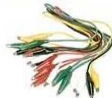
krokodyłki zacisk akumulatorowy pinzas cocodrilo