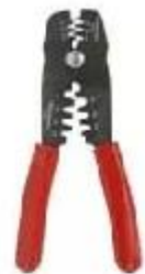
szcypce do zaciskania herramienta de engaste