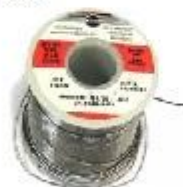
ołów do spawania plomo de soldar