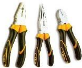
szcypce / kombinerki alicates

Sistema trifásico- Układ trójfazowy Sistemas de control remoto - System zdalnego sterowania Soldadura - Spawanie Taco - Wtyczka Taladradora de mano - Wiertarka Tensión eléctrica - Napięcie Timbre eléctrico – Dzwonek elektryczny Tornillo - Śruba Transformador - Transformator Transistor - Tranzystor Tubos de Geissler - Rura Geissler'a Tubos de rayos catódicos - Kineskop Tuerca- Nakrętka Válvula termoiónica - Rura próżniowa Vatio -Watt Voltio- Volt